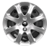
RINES DE ACERO DE 14"