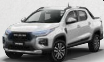
LARAMIE CVT TURBO