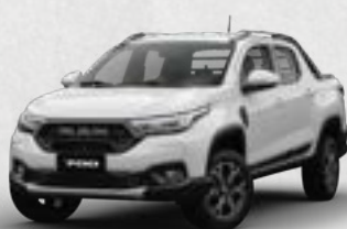
SLT REG CAB • SLT CREW CAB BIGHORN • BIGHORN CVT • LARAMIE CVT