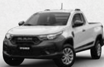
SLT REG CAB